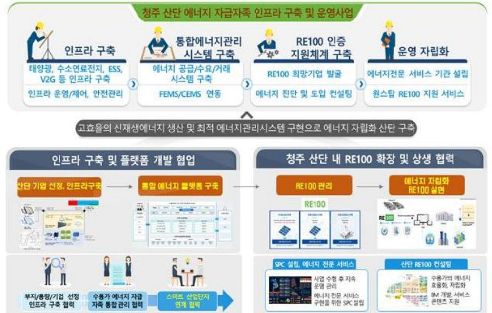
청주산단 에너지 자급자족 인프라 구축 예시